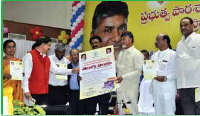
విశాఖపట్టణంలో ఆంధ్రప్రదేశ్ ప్రభుత్వం-పాఠశాల భాగస్వామ్యంతో 'తెలుగు పలుకు' కోర్సును ప్రారంభిస్తున్న ముఖ్యమంత్రి శ్రీ చంద్రబాబు నాయుడు